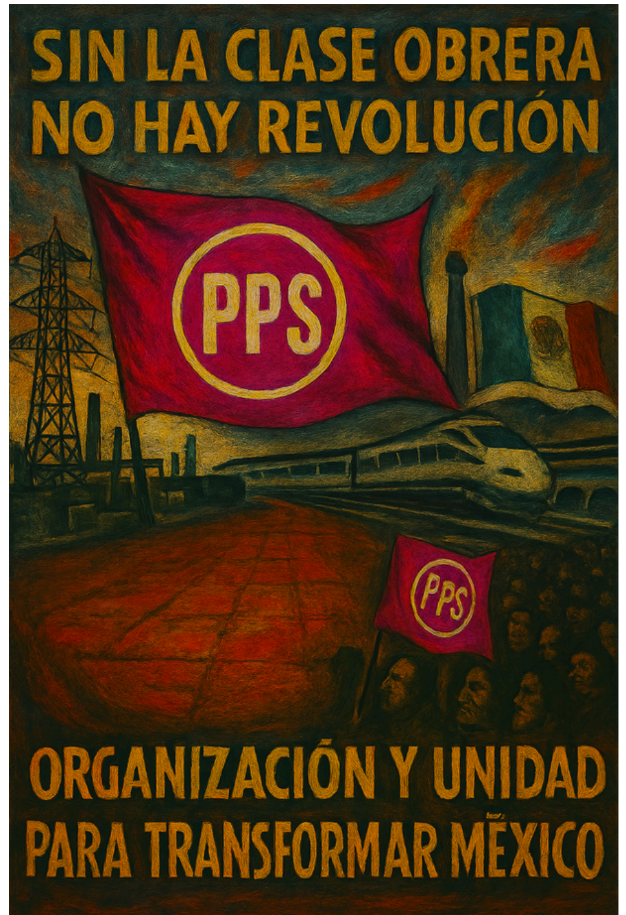
Imagen generada con Inteligencia Artificial por el C. Jorge I. Barroso

Sólo así se puede construir, sobre el viejo orden que está colapsando, un mundo mejor para los trabajadores de México y de todo el mundo, el mundo del socialismo.